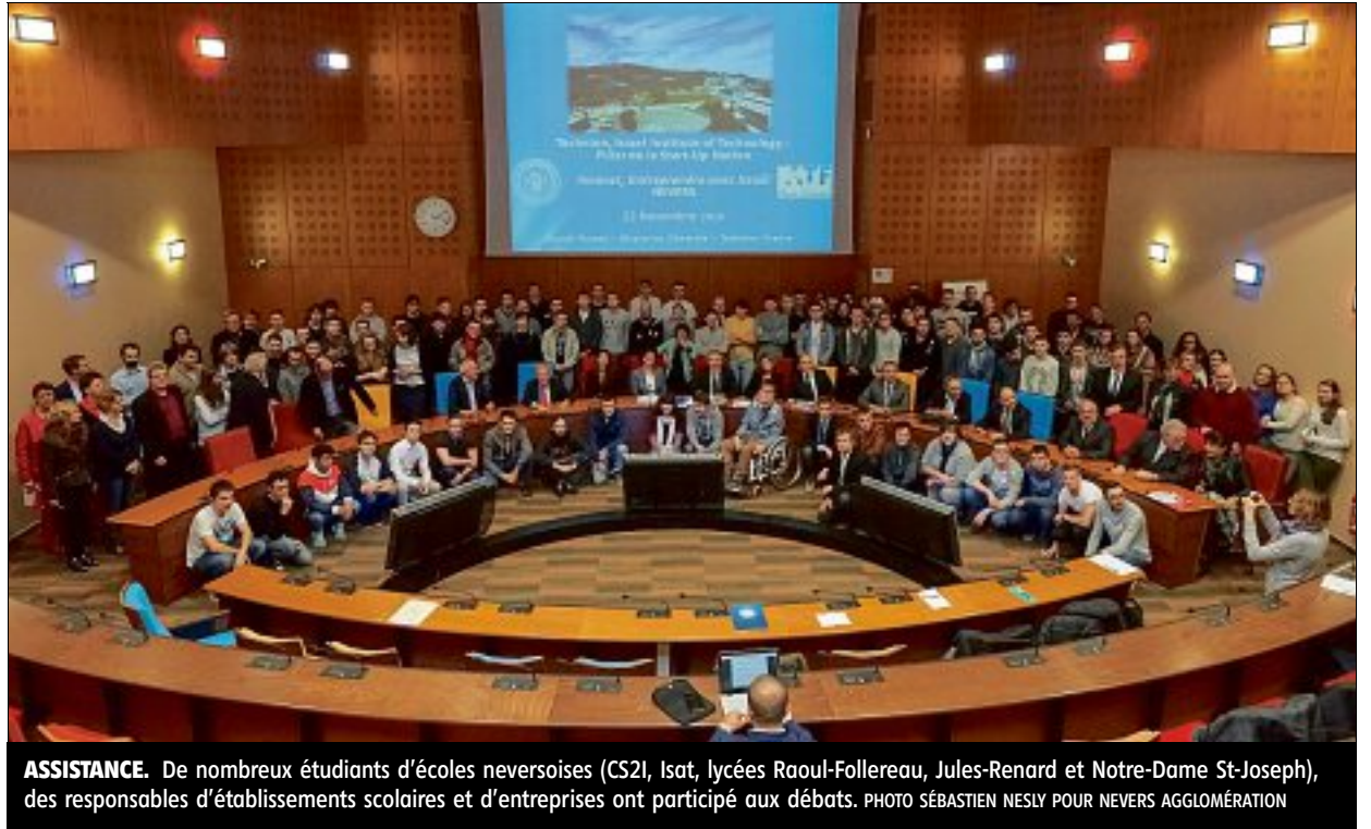
ASSISTANCE. De nombreux étudiants d'écoles neversoises (CS21, Isat, lycées Raoul-Follereau, Jules-Renard et Notre-Dame St-Joseph), des responsables d'établissements scolaires et d'entreprises ont participé aux débats.

Pour faire suite au voyage consacré au développement économique, que les élus ont effectué, fin septembre, en Israël, une journée intitulée "Innovater, entreprendre avec Israël" a été organisée, mardi, à l'Agglomération.